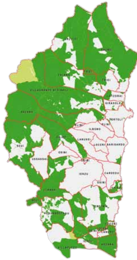
Provincia dell'Ogliastra Servizio Affari Legali, Programmazione, Cultura, Turismo e Pubblica Istruzione

Nel corso del convegno verrà presentato il lavoro svolto nella seconda fase, con l'intervento degli studiosi e dei professionisti che hanno partecipato al progetto, ma anche con la partecipazione di numerosi attori che svolgono un ruolo di primo piano in tema di terre collettive.